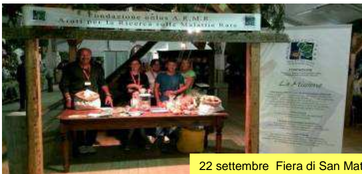
22 settembre Fiera di San Matteo a Branzi