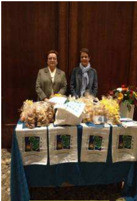
29 settembre Gorle