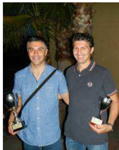
I vincitori del 1° torneo di tennis A.R.M.R.