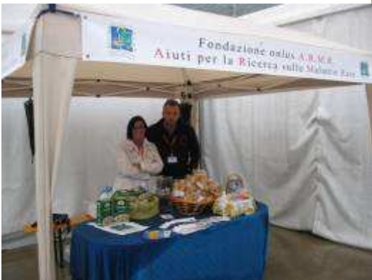
16 settembre Delegazione Sebino a Foresto Sparso