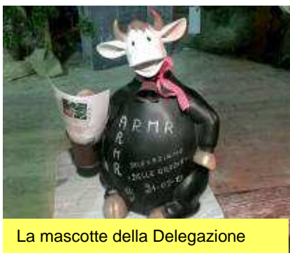
La mascotte della Delegazione