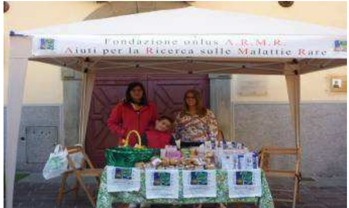
Gandino 22 settembre