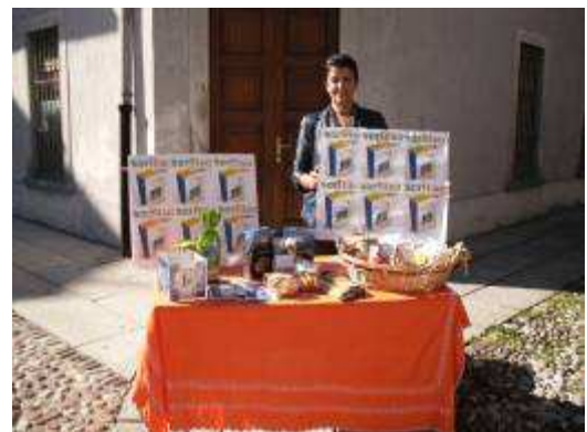
29 settembre Fino del Monte

presidenza@armr.it www.armr.it 035671906 segreteria@armr.it 035798518 3384458526 isuardi@tiscali.it 0354175245 3333642197