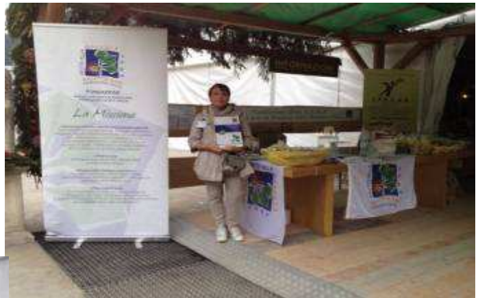
28 settembre Branzi