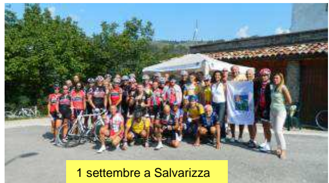
1 settembre a Salvarizza